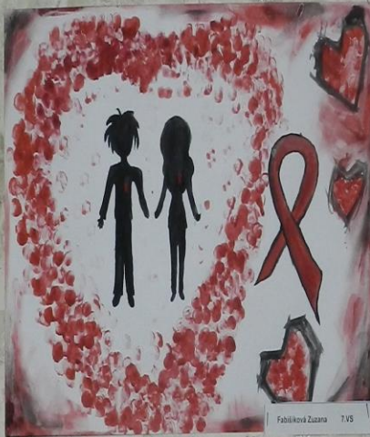
Fabíková Zuzana 7.VS