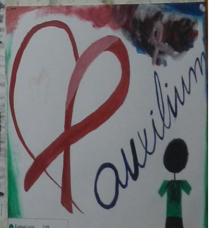
Čudná Lucia 7.VS